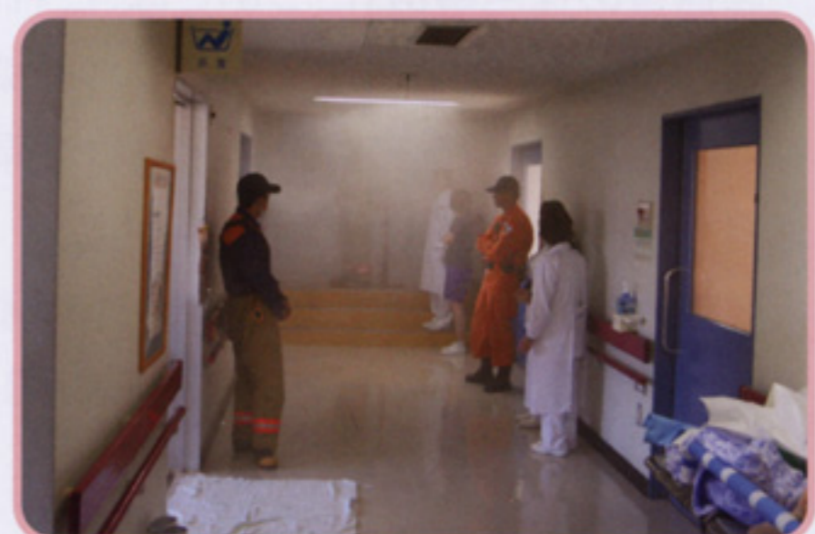
スモークマシン体験