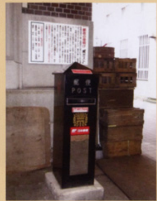
明治時代の書状集箱